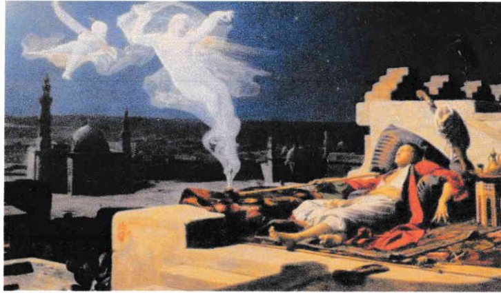
Jean-Jules-Antoine Lecomte de Nouÿ (1842-1923) Rêve d'eunuque, 1874, Museum of art, Cleveland.

Frappé d'une chose si extraordinaire et que je me reprochais presque, bien que ma raison protestât, j'en fis part à un de mes proches, aussi éprouvé que moi par le même deuil. Il m'avoua avoir fait sur lui la même remarque. J'interrogeai alors les personnes de mon entourage au sujet de faits analogues, s'il s'en était présenté de tels dans leur vie, et j'en obtins le plus souvent la même réponse, qui m'oblige à conclure ceci : en règle générale, les idées qui ont obsédé l'esprit pendant la veille ne reviennent pas en rêve ; on ne rêve des événements importants de l'existence que lorsque l'époque où ils préoccupaient l'esprit à un haut degré s'est éloignée.