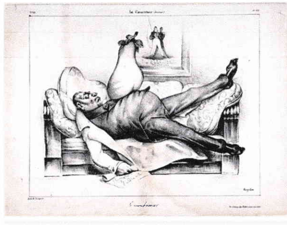
Honoré Daumier. Le cauchemar.

Combien de gens auraient vu là une prévision ou un avertissement du ciel ou encore un fait de suggestion à distance ! L'explication est pourtant bien simple. Le concierge avait glissé le télégramme sous la porte la veille au soir. En rentrant, mon ami l'avait vu ou plutôt en avait eu la perception visuelle, que son esprit distrait avait laissée inconsciente, et comme ces petits papiers bleus sont souvent les messagers des pires nouvelles, il avait bâti sur ce souvenir le rêve effrayant de la nuit.